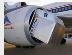
Ingesta a los motores

Ayuda con la detección y eliminación de F.O.D. para una operación segura