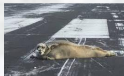
Restos de Fauna