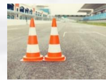
Equipos Ground Handling