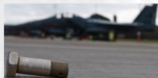
Herramienta en pista