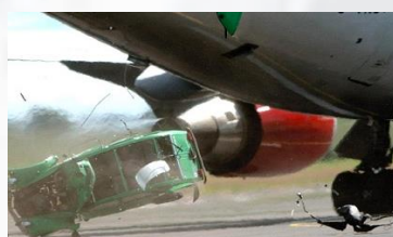
Daños por proyección de las partículas.